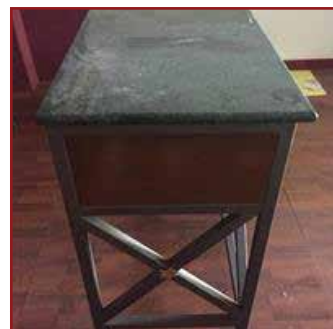
LOTTO COMPOSTO DA ARREDO, ATTREZZATURA PER NEGOZI E ABBIGLIAMENTO, CALZATURE DA LAVORO: LOTTO COMPOSTO DA: ARREDO, ATTREZZATURA PER NEGOZI, NR.2 PAIA DI STIVALI, CIRCA NR.50 CAPI DI ABBIGLIAMENTO TRA PANTALONI, SALOPETTE, PETTORINE, NR. 8 PAIA DI SCARPE DA LAVORO ELENCO BENI ARREDO ATTREZZATURA IN ALLEGATO VENDITA A LOTTO UNICO