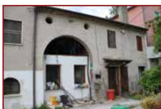
ALTAVILLA VICENTINA (VI) - LOC. TAVERNELLE, VIA SOVIZZO, 30 -

ALBETTONE (VI) - VIA VAL D'OCA, 11 - LOTTO 1) CASA rurale 2 piani (mq. 254): p. T: ingresso, soggiorno, cucina, c.t., bagno, ripostiglio, magazzino, corte; p. 1: 2 camere, bagno e, nella parte ristrutturata, soffitta, scoperto esclusivo (mq. 180), piccolo rustico (mq. 8). Occupato. Prezzo base Euro 15.500,00. Offerta minima: Euro 11.625,00. VIA VAL D'OCA, SNC - LOTTO 2) RUSTICO: (mq. 133,10) magazzino, portico p. T e granaio nel sottotetto. Mai ristrutturato, privo di impianti e in precarie condizioni. Libero. Prezzo base Euro 9.000,00. Offerta minima: Euro 6.750,00. Vendita senza incanto 25/09/18 ore 09:50. Custode Giudiziario IVG tel. 0444953915. Rif. RGE 526/2011