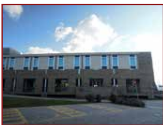
AREZZO - LOCALITA' INDICATORE, STRADA C - VENDITA TELEMATICA MODALITA' SINCRONA MISTA