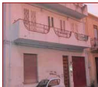
BARCELLONA POZZO DI GOTTO (ME) - VIA ON. PINO

BALLOTTA 3 - (VIA S. ANDREA P. 2) - PIENA PROPRIETÀ DI UN APPARTAMENTO , posto al piano secondo, di un fabbricato a tre elevazioni fuori terra, dalla superficie lorda di circa mq 154,00, identificato catastalmente al foglio 7, particella 626 sub.20, categoria A/2, classe 9, consistenza vani 7, rendita catastale € 379,60. Prezzo base Euro 106.700,00. Offerta minima: Euro 80.025,00. Data presentazione offerte: 13/12/18 ore 12:00. Vendita senza incanto 14/12/18 ore 16:30. G.E. Dott. ssa Anna Smedile. Professionista Delegato alla vendita e Custode Giudiziario Avv. Francesca Genovesse tel. 0909701612. Per info A.C.G.D.V. Ass. Custodi Giudiziari e Delegati alle Vendite tel. 0909765295. Rif. RGE 133/2012 BC583090