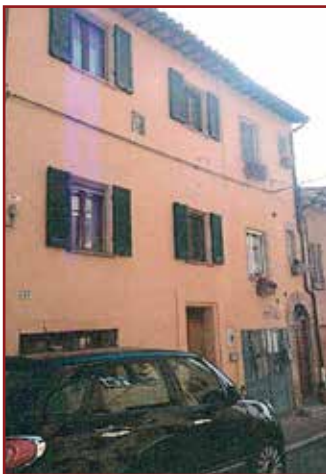
TORGIANO - LOCALITA' FORNACI DI PONTE NUOVO,

VIA EUGENIO MONTALE, 29 - VENDITA TELEMATICA MODALITA' ASINCRONA - DIRITTI DI PIENA PROPRIETÀ SU FABBRICATO INDIPENDENTE AD USO ABITATIVO E TERRENO DI PERTINENZA ADIBITO A GIARDINO. Il fabbricato è così formato: il fabbricato di civile abitazione si eleva per due piani fuori terra (oltre al piano sottotetto), e si sviluppa per calpestabili mq. 327 circa (comprensivi del loggiato e dei terrazzi) ed è composto: Piano terra da ingresso, vano scala, soggiorno, tinello/cucina, disimpegno, bagno, con garage e loggiato esterno; Primo piano da ingresso, soggiorno, tinello, cucina, due camere, disimpegno, bagno e tre terrazzi; Al piano sottotetto da disimpegno, e tre vani adibiti a soffitta. Il lotto di terreno su cui insiste il fabbricato, si sviluppa per catastali mq. 575 (al lordo della superficie occupata dal manufatto) e rappresenta pertinenza esclusiva dello stesso. Prezzo base Euro 166.400,00. Apertura buste c/o Studio Avv. Colonni Citta' Di Castello via Morandi n. 3 in data 15/06/21 ore 15:00 Offerta minima: Euro 124.800,00. G.E. Dott.ssa Giulia Maria Lignani. Professionista Delegato alla vendita Avv. Gianluca Colonni tel. 0754652385. Custode Giudiziario Istituto Vendite Giudiziarie di Perugia tel. 0755913525. Rif. RGE 49/1994+135/2006 PE753673