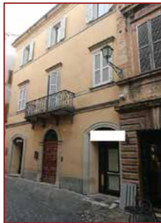
RIPATRANSONE - CONTRADA SAN SAVINO SNC - LOTTO 2)

OFFIDA - CORSO SERPENTE AUREO, 71 - VENDITA TELEMATICA MODALITÀ SINCRONA MISTA - LOTTO 2) DIRITTI PARI ALL'INTERO DELLA PIENA PROPRIETÀ SU UNITÀ IMMOBILIARE DESTINATA A NEGOZIO posto al piano terra, 50 mq. Prezzo base Euro 37.320,00 Rilancio Minimo 3%. Offerta minima Euro 27.990,00. Vendita senza incanto c/o Tribunale di Ascoli Piceno in data 09/11/21 ore 17:00. G.E. Dott.ssa Simona D'Ottavi. Professionista Delegato alla vendita Dott.ssa Emanuela Zannoni tel. 3479058740. Custode Giudiziario Dott. Simone Corradini tel. 0735/86835. Rif. RGE 6/2018 ASC764862