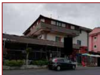
CASSANO ALLO IONIO (CS) - VIA FRANCESCO BRUNO,