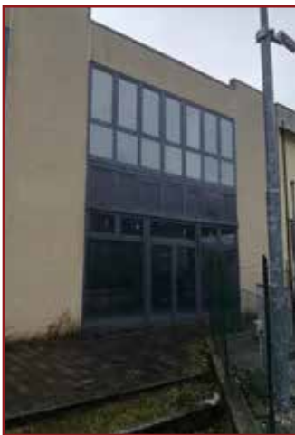
SANT'ANGELO IN VADO - VIA CA' MASPINO - LOTTO 1)