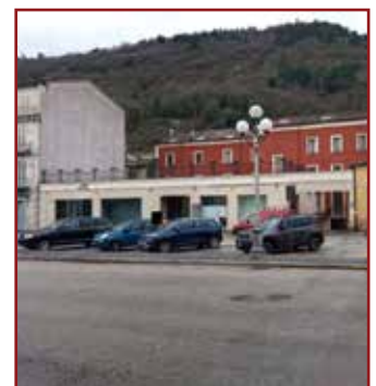
BOJANO (CB) - PIAZZA ROMA, 1-2 - VENDITA

mq 239, piano secondo. (L'immobile necessita di regolarizzazione urbanistica, sismica e catastale). Prezzo base Euro 75.000,00. Offerta minima: Euro 56.250,00. Offerta minima in aumento Euro 1.500,00. Cauzione 10% del prezzo offerto. CORSO UMBERTO 1, 37 - VENDITA TELEMATICA MODALITA' SINCRONA MISTA - LOTTO 14) UNITÀ IMMOBILIARE in corso di costruzione- Appartamento nel N.C.E.U. di Campobasso al foglio 62 del Comune di Bojano Corso Umberto I n.37, Part. 718 sub 54, Zona censuaria 1, Categ. in corso di costruzione, Consistenza mq 583, piano terzo (sottotetto). (L'immobile necessita di regolarizzazione urbanistica, sismica e catastale) Prezzo base Euro 135.000,00. Offerta minima: Euro 101.250,00. Offerta minima in aumento Euro 2.700,00. Cauzione 10% del prezzo offerto. Vendita telematica con modalità sincrona mista il giorno 23/06/23 ore 10:10 presso la Sala Aste del Tribunale di Campobasso, alla Piazza Vittorio Emanuele II, n.26. Per maggiori informazioni relative alla gara telematica consultare il sito www.spazioaste.it . G.E. Dott.ssa Claudia Carissimi. Professionista Delegato alla vendita Dott.ssa Lucia Morgillo, Bojano Località Malatesta 10, tel. 0874778804. Custode Giudiziario Istituto Vendite Giudiziarie Molise tel. 0874416150 email aste@ivgmolise.it . Rif. RGE 39/2020 CPB833725